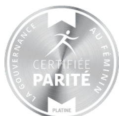
Sceaux parité - Français - Platine